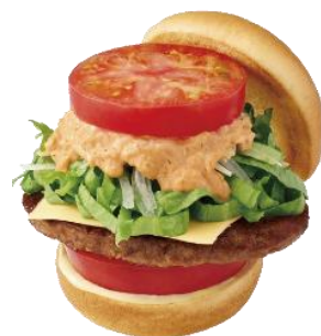
「新とびきり大盛りトマトモス野菜チーズバーガー」のイメージ

【取材対応日時】※取材にお越し頂ける場合は2月12日午前中までにご連絡ください。