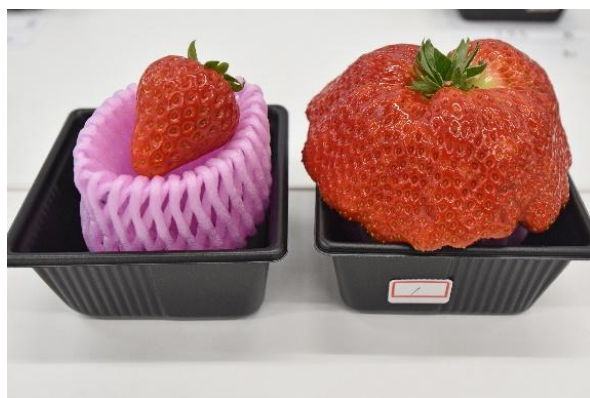
▲過去に出品された「でかほっぺ」（右）