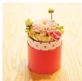
「ヒトハナ」(イメージ)