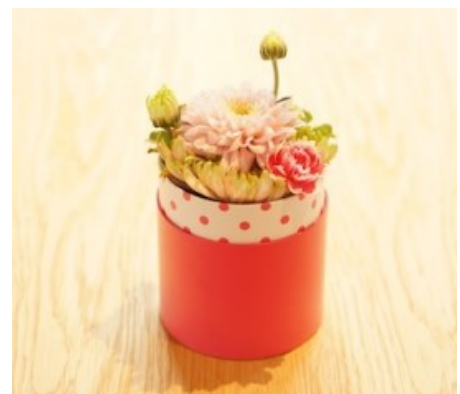
「ヒトハナ」のボックスフラワー(イメージ) ※イベント当日の花材はバラを使用します