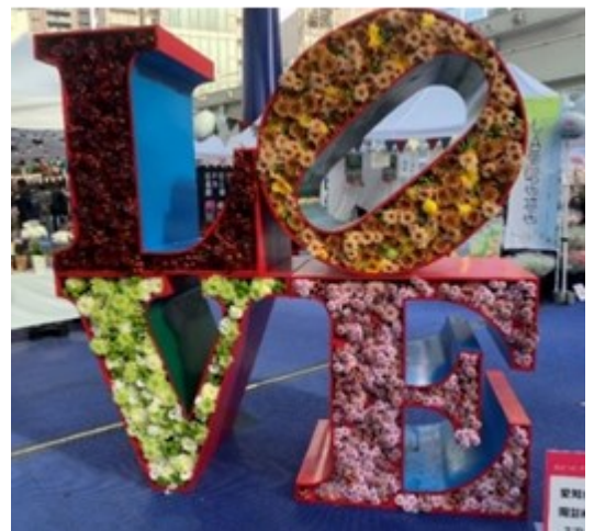
フォトスポット(イメージ)