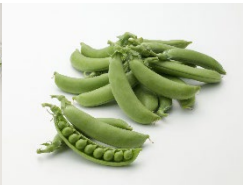
スナップエンドウ