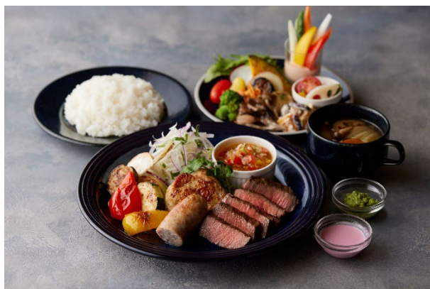
グリル料理に産直野菜ビュッフェ が付いたランチメニュー