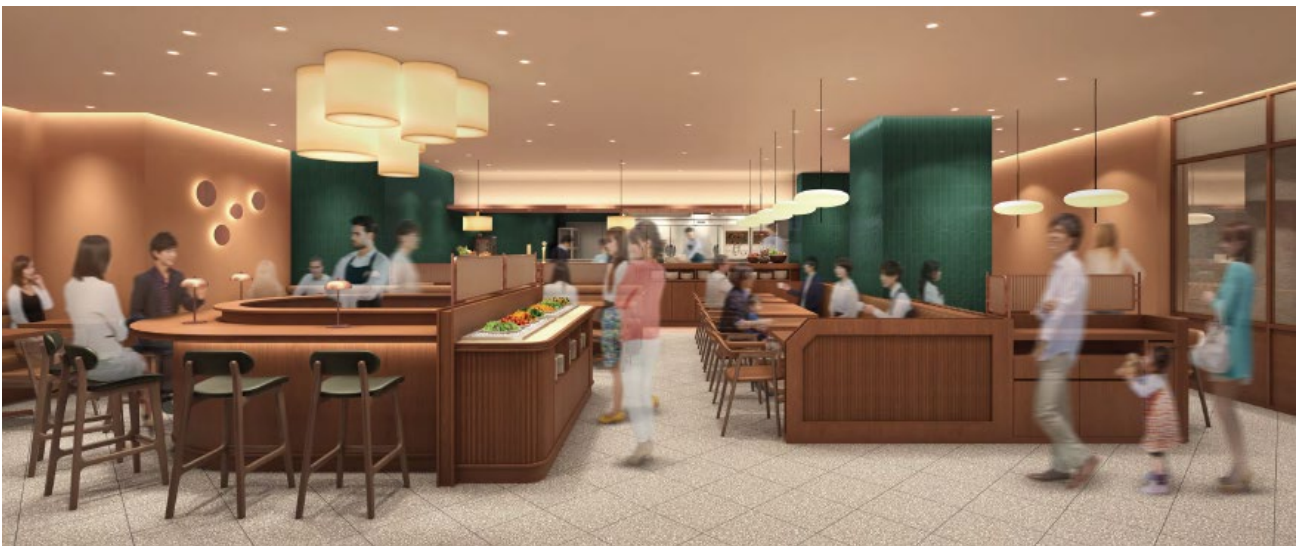
店舗を象徴する「産直野菜ビュッフェ」を店舗入口に配置 一人様でも気軽にご利用いただけるカウンター席も用意