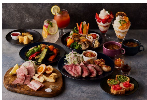
産直野菜ビュッフェ、グリル料理、ドリンク、フルーツパフェ等 をコース仕立てで提供するディナーメニュー