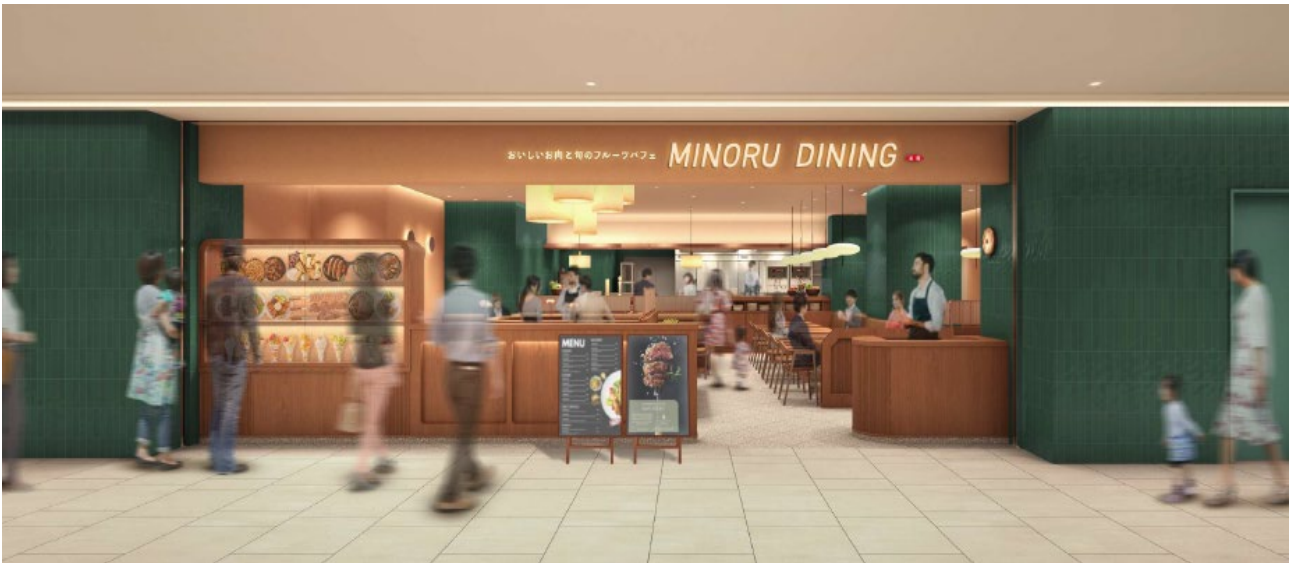
J Aグループらしさをイメージした「グリーン」のタイルが印象的な店舗ファサード