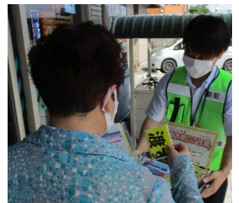
下之一色支店（中川区）