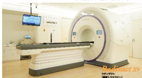
トモセラピー 360度方向から、広範囲にわたる高精度な放射線治療

予防医療や相談支援・がんの3大治療・ゲノム医療・緩和医療センターなどの各種機能を集約し、切れ目のないがん治療を実現。