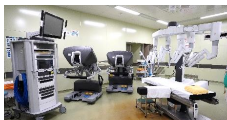
ダヴィンチ Xi 内視鏡手術で患者さんにより負担の少ない手術を提供

最新鋭の放射線治療装置「サイバーナイフ」と「トモセラピー」を同時導入し、従来遠方の病院へ紹介していた症例のがん治療が可能に。