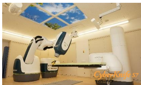
サイバーナイフ ピンポイントで照射する高精度放射線治療装置