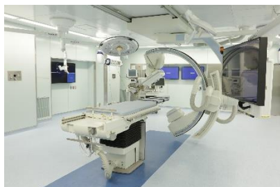
ハイブリッドラボ