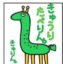
西三河冬春きゅうり部会のキャラクター「きゅりん。」

https://www.maff.go.jp/j/tokei/kouhyou/sakumotu/sakkyou_yasai/