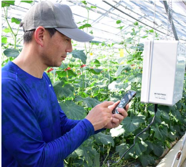
環境測定器「あぐりログBOX」(白い箱)と、スマートフォンで温度・湿度などを確認します