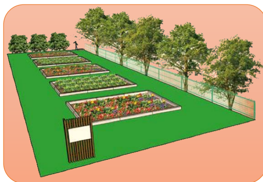
↑農園のイメージ図