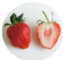
まろやかな甘み 「やよいひめ」