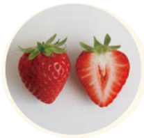
鮮やかな赤色で洋菓子店からも人気！酸味より甘み広がる「よつぼし」