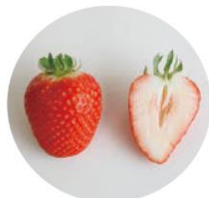
酸味穏やかですっきり！ 「かおり野」

ジューシーな甘さの「章姫」や大きい「紅ほっぺ」をはじめ有名産地に負けない様々な品種を栽培しています。各生産者によって栽培品種が異なるため、お気に入りの品種探しに巡回するのもオススメです。