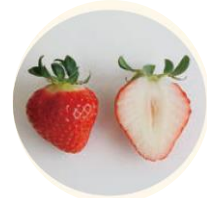
果肉大きく甘み・酸味のバランス抜群 「恋みのり」