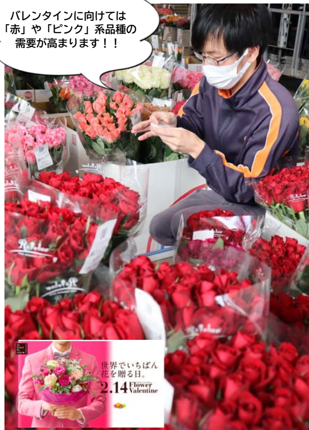
▲選果場での出荷作業